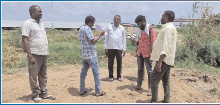
తెలంగాణ క్యాపిటల్ న్యూస్ ఎడిటర్

అయ్యోరుకుంట మాయంపై.. సర్వేకు ఆదేశించిన తహశీల్దార్